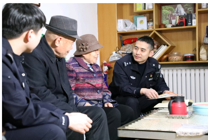
12月8日,未央公安民警走访辖区老人。

步进行。未央公安立足“五共三排一管理”机制,前期通过社区走访、数据排查,建立起涵盖独居、空巢、高龄老人的“一人一档”帮扶台账,精准标注老人健康状况、居住环境、安全隐患等关键信息,实现“底数清、情况明、需求准”。